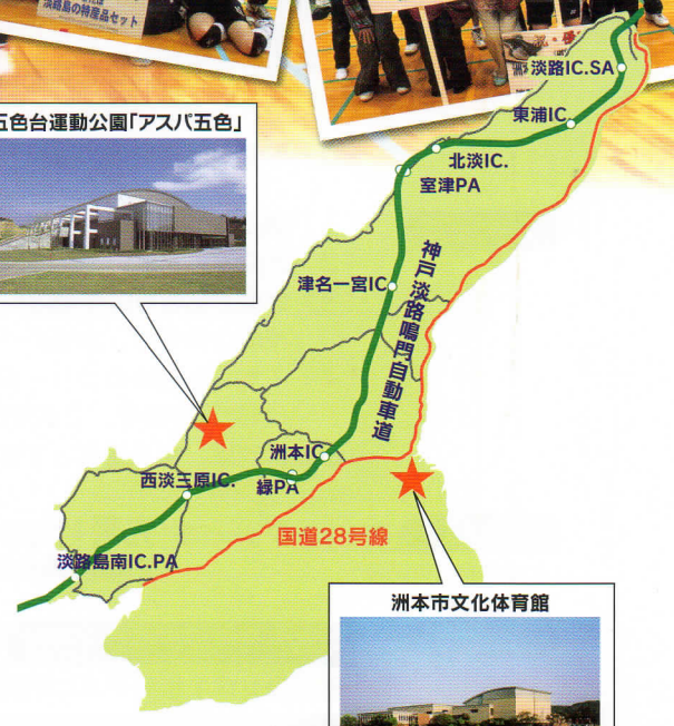
洲本市文化体育館