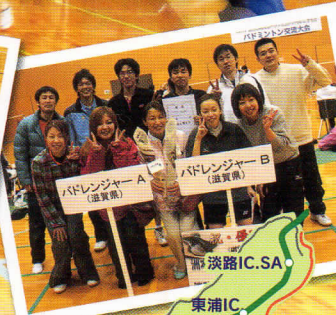
五色台運動公園「アスパ五色」